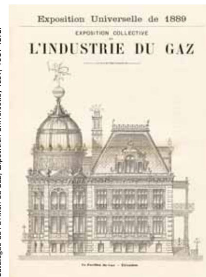
Catalogue du Pavillon du Gaz, Exposition Universelle, 1889, V801 1292.

À la recherche du patrimoine industriel et ouvrier dans le 19 e arrondissement