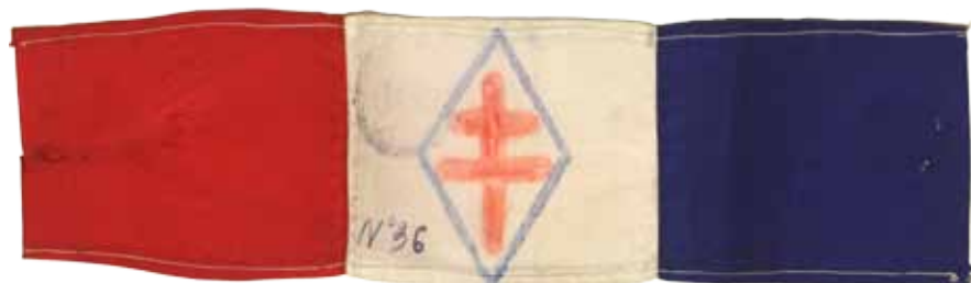
Brassard porté par les partisans lors la libération de Paris, août 1944, D51Z 72.

Pour les ateliers personnalisés et les thèmes spécifiques, merci de contacter un semestre à l'avance le professeur relais pour construire ensemble votre projet.