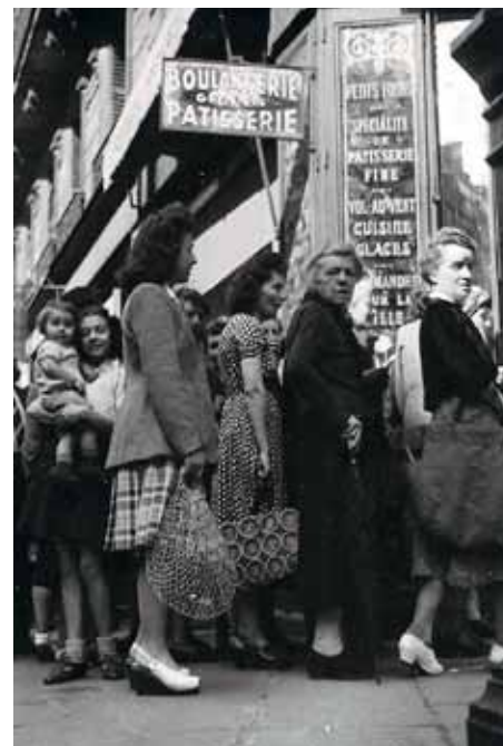
File d'attente devant une boulangerie pendant l'Occupation, 1944, D38Z 5.

Vivre à Paris sous l'Occupation, 1940-1944