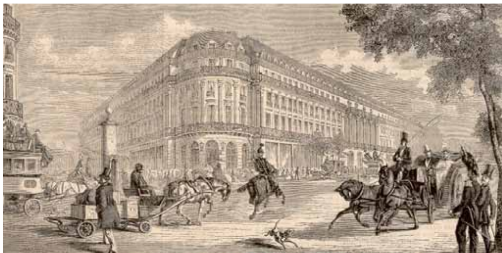
Boulevard des Capucines, in L'univers illustré, 1862, D18Z 7.

Par la diversité des documents qui y sont présentés, les ateliers du service éducatif peuvent répondre aux objectifs du parcours citoyen et des parcours d'éducation artistique et culturelle de chaque élève.