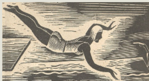
Vignette extraite d'un agenda du Bon Marché, accompagnée d'un texte, 1929. Archives de Paris, D12AZ 18.

« Pourquoi, dans un pays comme le nôtre, où l'eau abonde de toutes parts, négligeons-nous autant la natation ? Quel exercice, pourtant, vaut celui-là ? Ebats gracieux dans un milieu inaccoutumé, parfaite liberté de mouvements, travail musculaire de toutes les régions du corps, entraînement du courage et de la volonté, et, par surcroît, excellente école de sauvetage et de salut pour soi-même ou pour les autres, voilà ce que la natation représente. »